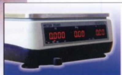
Kundenkontroll-Anzeige: Immer alles im Blick!