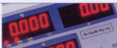
LED-Anzeige für mehr Bedienkomfort.